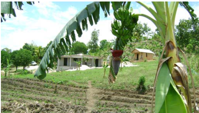
Vue d'une partie du terrain et de nos premières mai- sons construites...