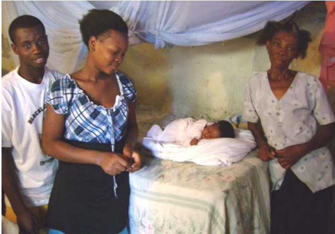
« Notre » jeune couple avec leur bébé de 2 mois chez la maman de la dame. Avant de venir à Trianon, ils étaient 10 à vivre dans un TRÈS PETIT appartement, le couple ayant été délogé du campement où ils vi- vaient dans une tente depuis le tremblement de terre !