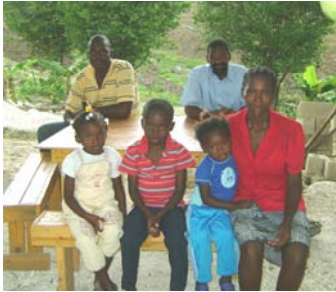
Au premier plan, « notre » 1 ère veuve avec ses 3 jeunes enfants. À l'arrière plan, deux de nos trois collaborateurs haïtiens.